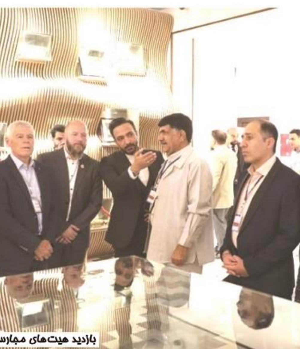
بازدید هیئت‌های مهارستانی و ارمنستانی از موزه کشریفات